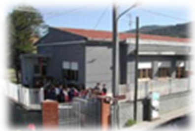
Plesso di Piscittina

Approvato dal Consiglio di Istituto verbale n.3 del 13/01/2016