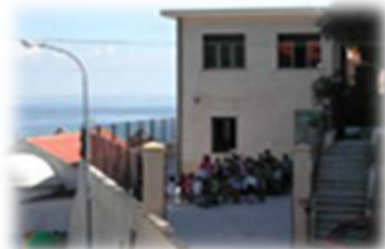
Plesso di Scafa

Istituto Comprensivo Statale n.2 “Giovanni Paolo II”