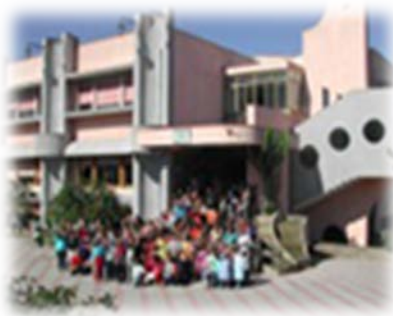
Plesso di Furriolo

“L'educazione è l'arma più potente per cambiare il mondo” Nelson Mandela